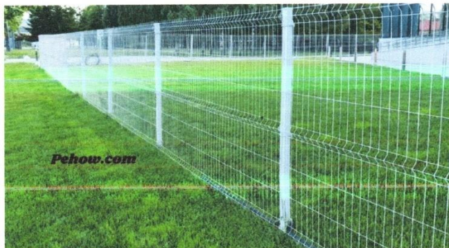
Загвар зураг 2