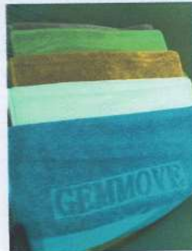
Ус даах чадвартай, материал сайтай