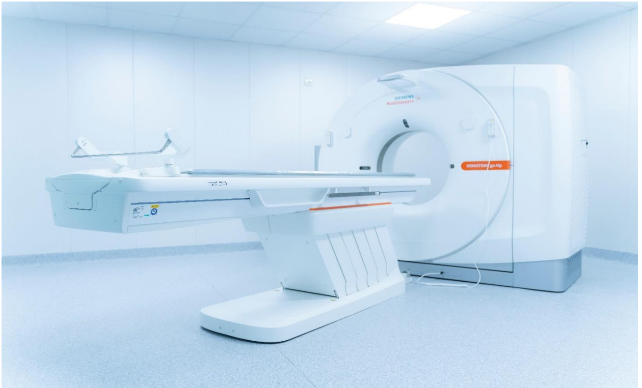
Зураг 1. Siemens Healthineers, Somatom go. Ур загварын 64 зүслэгтэй Компьютерт томографийн аппаратын харагдах байдал