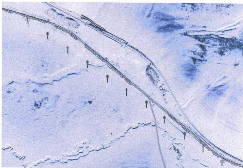
Зураг №1. ЦДАШ-ын байршлын зураг