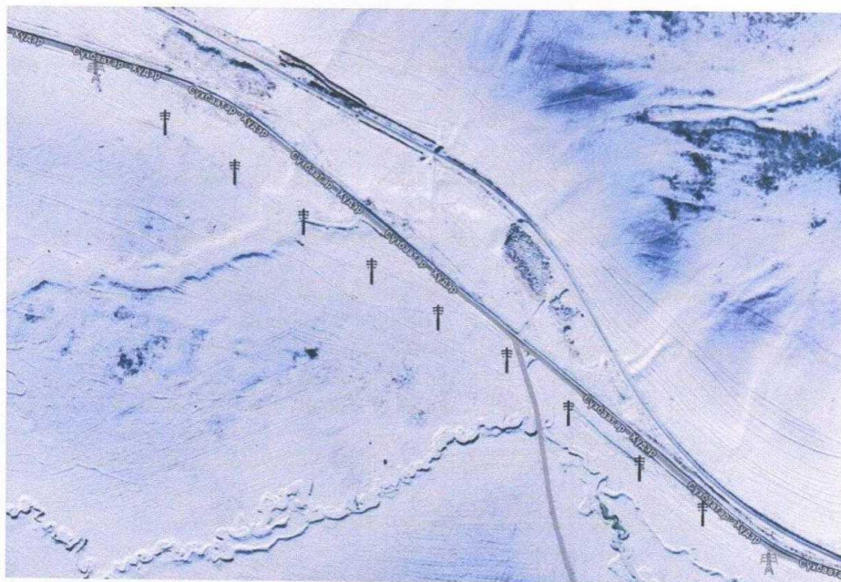
Зураг №1. ЦДАШ-ын байршлын зураг