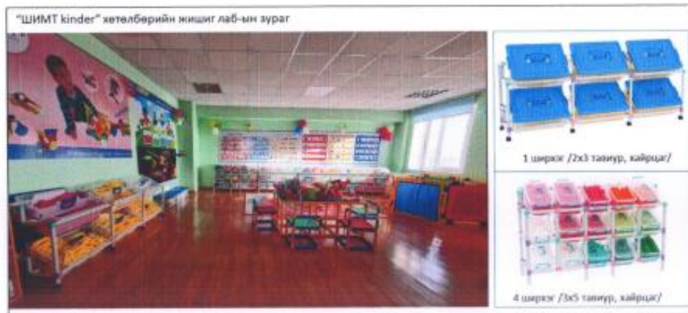
Том, жижиг нийт 66 хайрцаг хэрэглэгчдэхүүнтэй.

"Цогц шийдэл" нь агуулга, арга зүй, хэрэглэгчдэхүүнээс тогтоно.