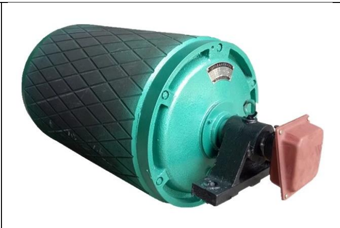
Хөтлөх моторт дамрын хэмжээст зураг.