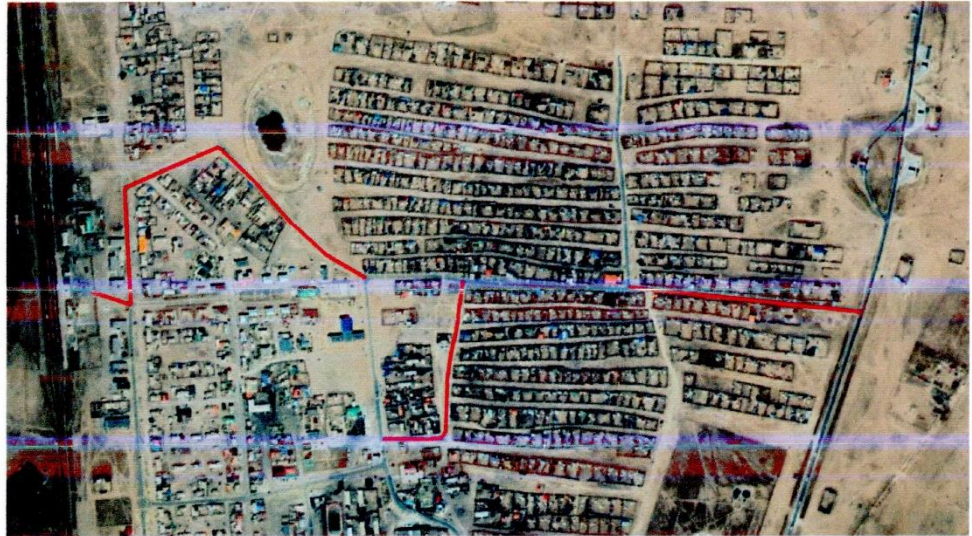
СҮМБЭР СУМЫН ГАНЗАМ, САНСАР БАГТ ХИЙГДЭХ ЯВГАН ХҮНИЙ ГАРЦЫН ТЭМДЭГЛЭГЭЭНИЙ БАЙРШИЛ:

СҮМБЭР СУМ, ГАНЗАМ, САНСАР БАГУУДАД ХИЙГДЭХ АВТОЗАМЫН ХЭВТЭЭ ТЭНХЛЭГИЙН ЦАГААН ЗУРААС БОЛОН ЯВГАН ХҮНИЙ ГАРЦЫН БАЙРШИЛ АЖИЛ ХИЙХ СХЕМ ЗУРАГ: