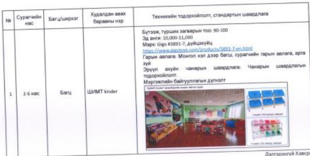
Дэлгэрэнгүй Хавсралт 1

Хэрэглэгчдэдхүүнээр тохижуулсан ангийн зураг