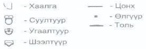
Нойлын план зураг