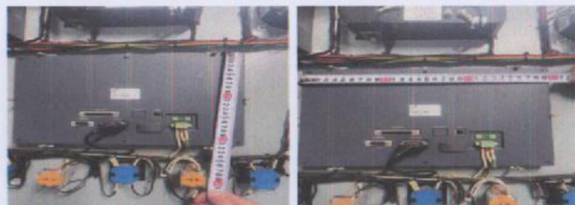
Зураг-8,9. /Kinco MT4500T загварын НМI дэлгэцийн арын хэсгийн хэмжээст зураг