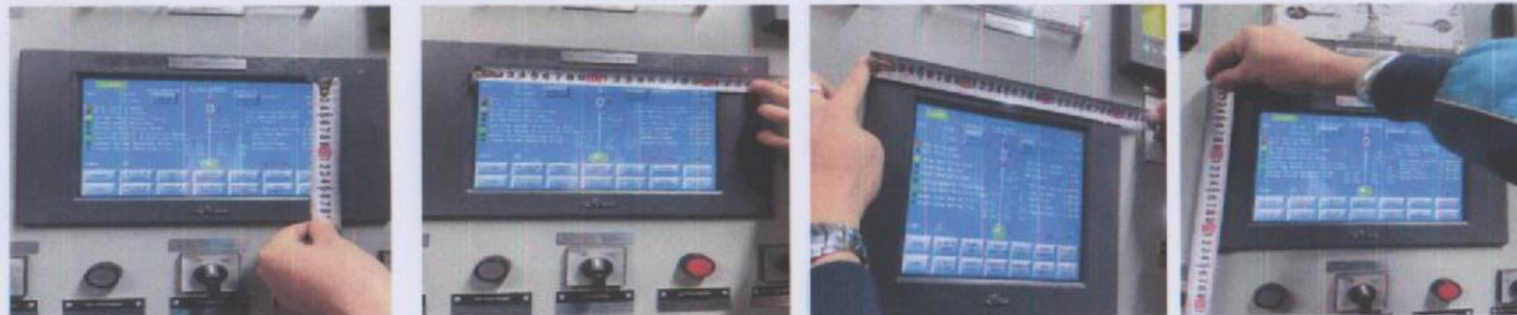
Зураг-4,5,6,7. /Kinco MT4500T загварын HMI дэлгэцийн нүүрэн талын хэмжээст зураг/