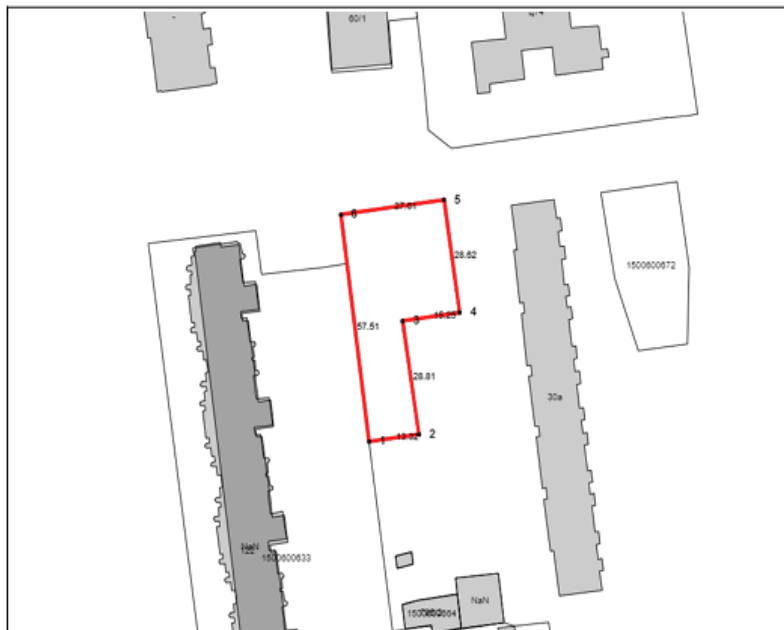
Зургийн масштаб = 1:1000 (1 сантиметр 10 метр багтана)