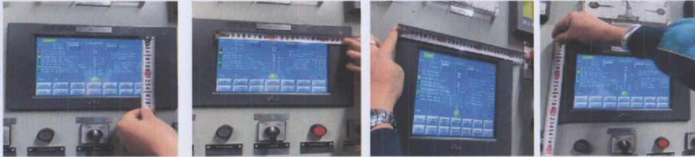
Зураг-4,5,6,7. /Kinco MT4500T загварын HMI дэлгэцийн нүүрэн талын хэмжээст зураг/