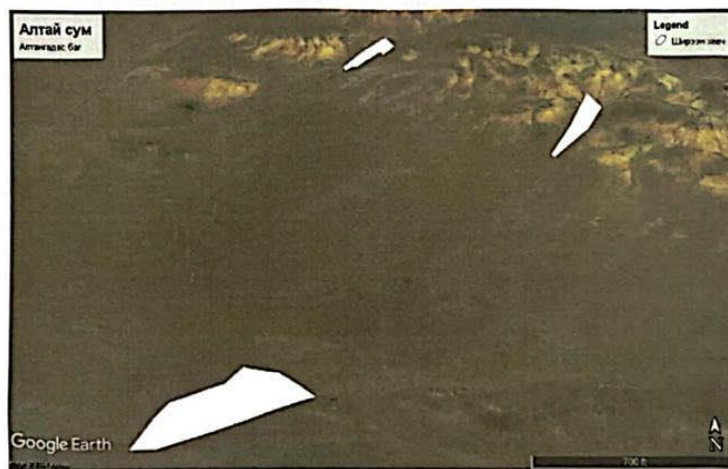
ЭВДРЭЛД ОРСОН ГАЗРЫН ТӨЛӨВ БАЙДАЛ