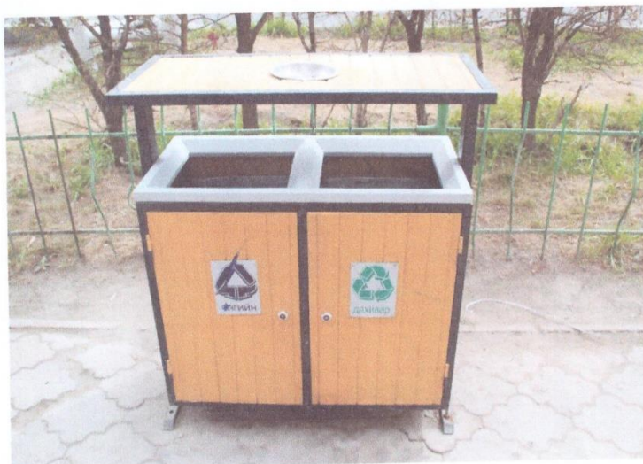
Хогийн савны жишээ зураг