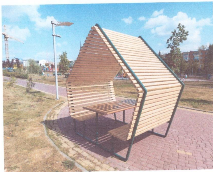
Сүүдрэвчний жишээ зураг