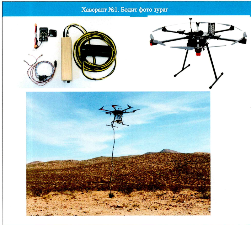
Хавсралт №1. Бодит фото зураг