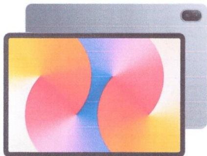
-Таблет жишээ зураг