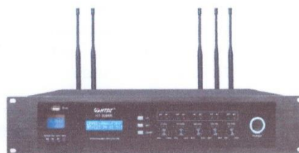
Төв удирдлагын төхөөрөмж жишээ зураг