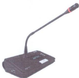
Утасгүй хурлын микрофон