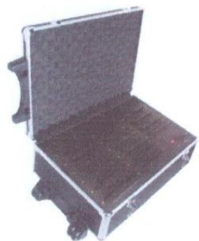
Утасгүй микрофоны батерей цэнэглэгч